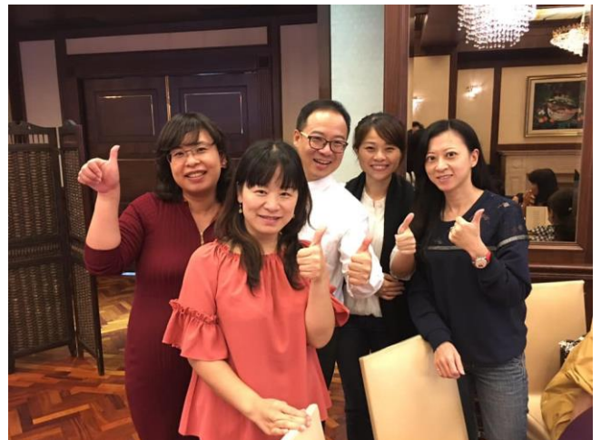
▲生技系系主任、老師及許多畢業系友們共襄盛舉