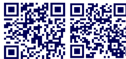
校友服務網 QR Code 校友服務臉書粉絲團

電話：03-2118800#5426 E-mail： alumni@mail.cgu.edu.tw