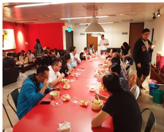
▲校友在管院 RED TABLE 區用餐