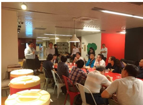
▲宮大川院長為活動開場

歡聚的時光總是短暫，活動最後，校友們也共同成立了「CGUBA 產業縱橫/金融投資」Line 群組，希望能繼續將歷屆工商系校友的情感串聯起來，凝聚在一起，共享更多好的經驗與訊息，讓本校工商系師生、畢業校友，在畢業之後也可以共組一個工商系友大家庭，繼續互相協助與扶持。