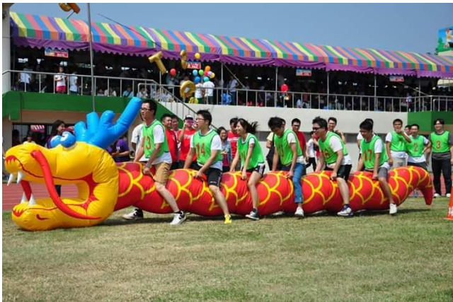
▲培養良好的團隊合作