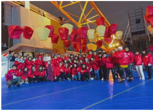
▲擔任東京鐵塔台灣祭志工