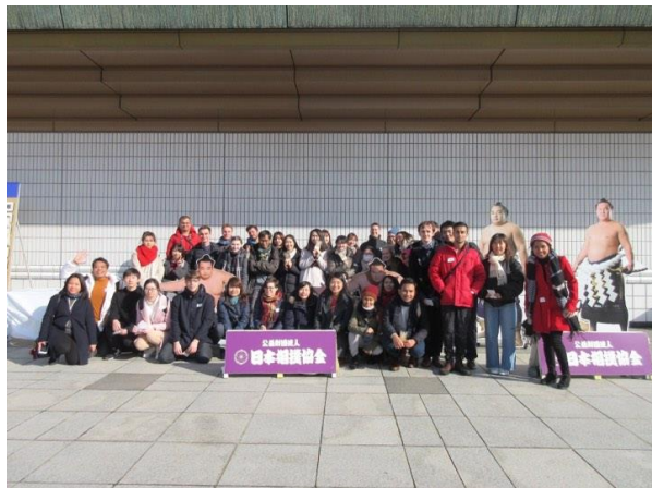
▲立教大學舉辦之相撲觀光一日遊