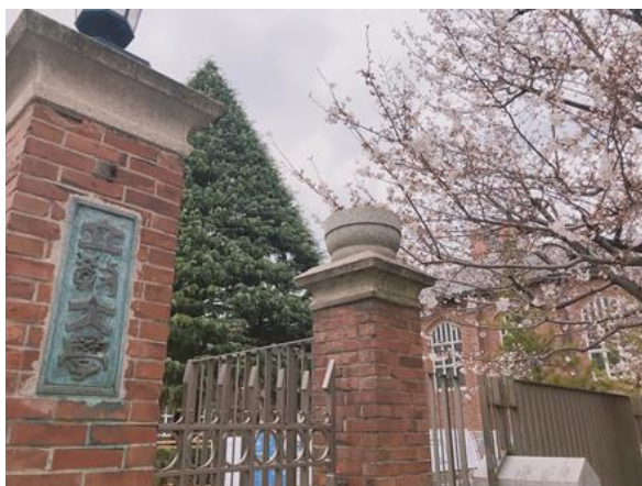
▲立教大學側門一景